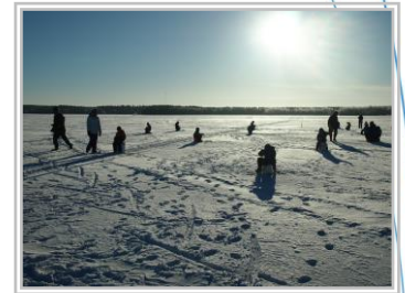
Perinteiset koululaisten ja perheiden pilkkipäivät starttaavat taas helmikuussa.