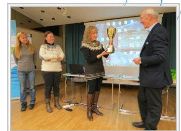
Mommilanjärven Soutelu ry:n Ympäristötökopalkinto 2015 myönnettiin Vanajavesikeskukselle. Saatu palkinto on hieno tunnustus vesien hyväksi tehdystä työstä!