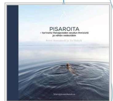
Pisaroita-kirjan voi ostaa omaksi kirjakauppojen lisäksi muun muassa Vanajavesikeskuksesta ja Wetterhoffin talolta.