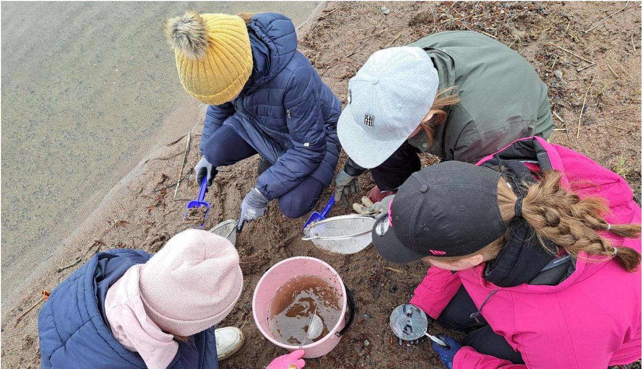
Hiekkarannoilta löytyy monenlaista muoviroskaa. Hämeenlinnan Muovikassi -hankkeessa selvitetään mitä ja kuinka paljon.