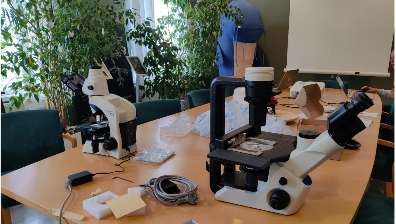
Uudet lahjoitusvaroin hankitut mikroskoopit avasivat uusia pienen mittakaavan maailmoja.