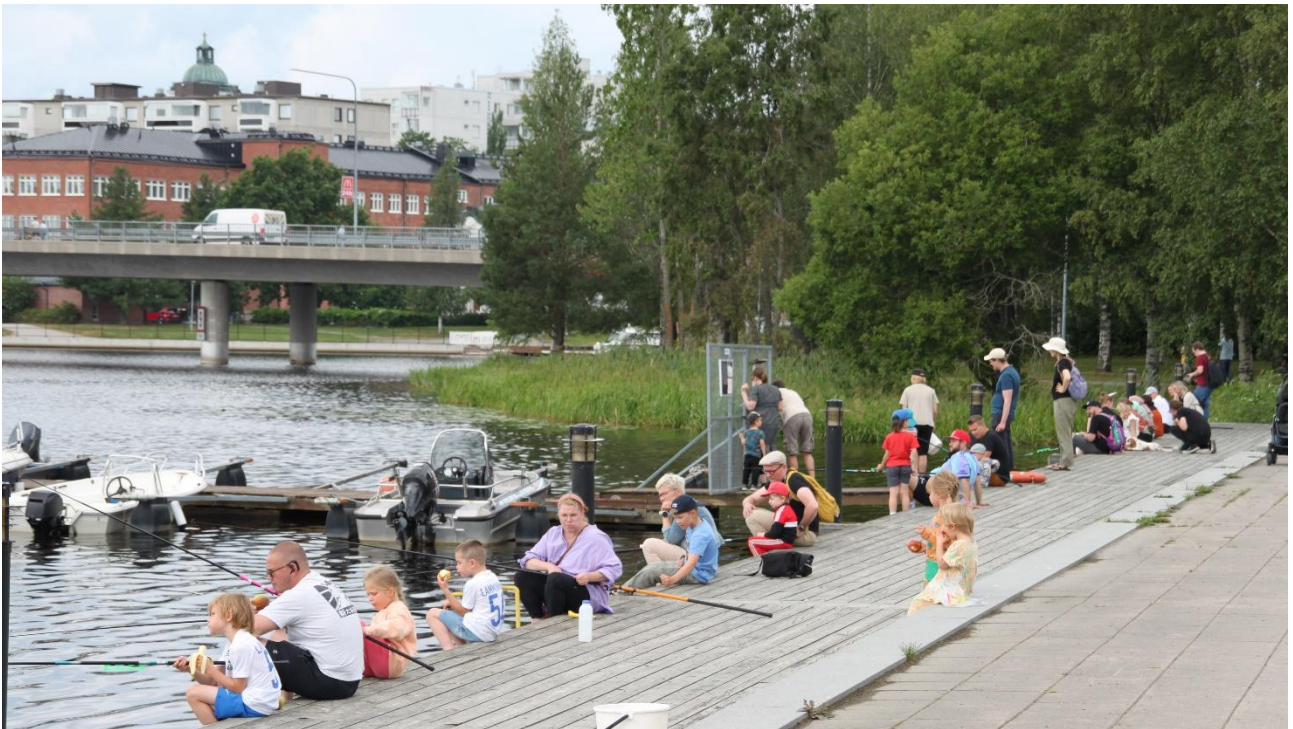
Hippaloilla ongittiin perheiden voimin.