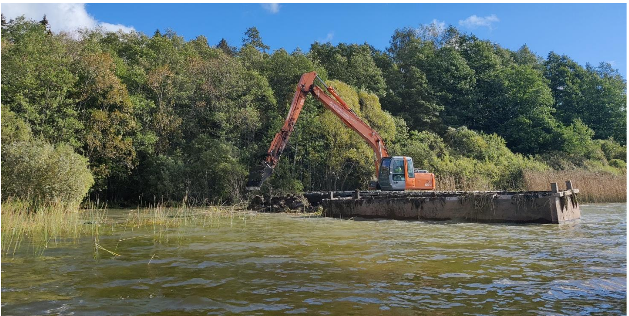
Isosorsimon poistamiseen käytettiin kelluvaa kalustoa useammassa kohteessa eri puolilla toimialuetta, kuva Ilona Vuorinen.