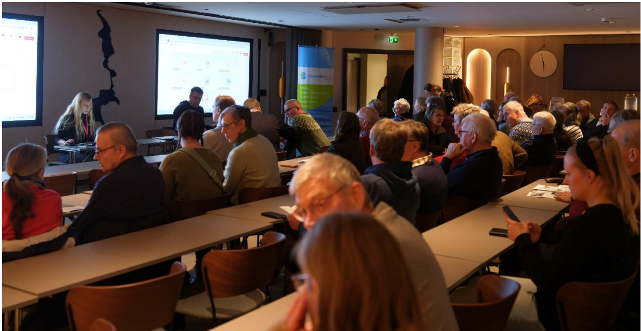
Järvitärskyt 2025 kokosi vesistöaktiivit uudistettuun Vaakuna-hotelliin.