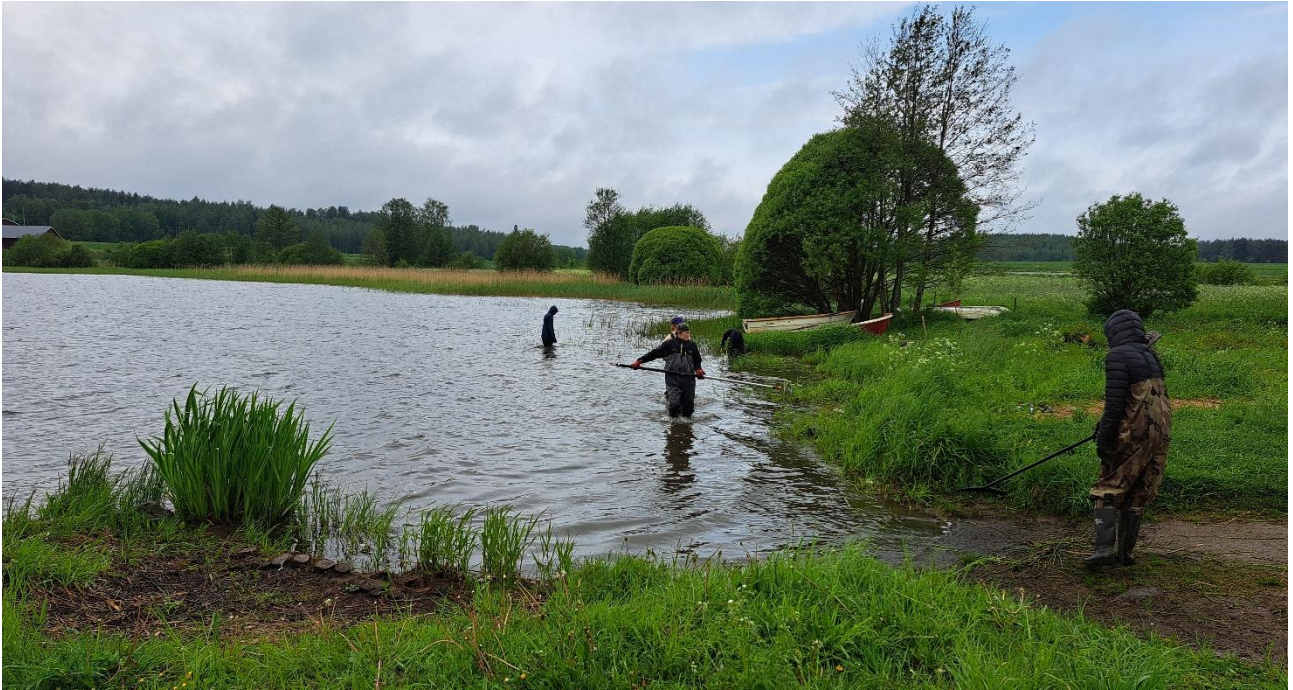
Lehijärven Pelkolan kylän ranta oli Hattulan nuorten remppaleirin kohteena kesällä 2025.