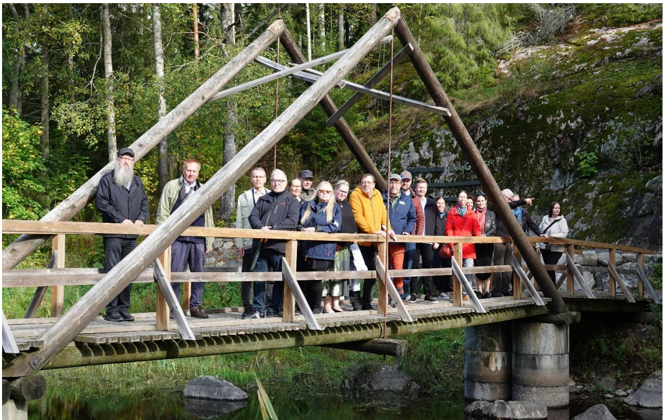
Teuronjoen Koskenkosken patomuutoskohdetta esiteltiin Neuvottelukunnan jäsenille. Hämeenkoski, kuva: Heidi Kontio.