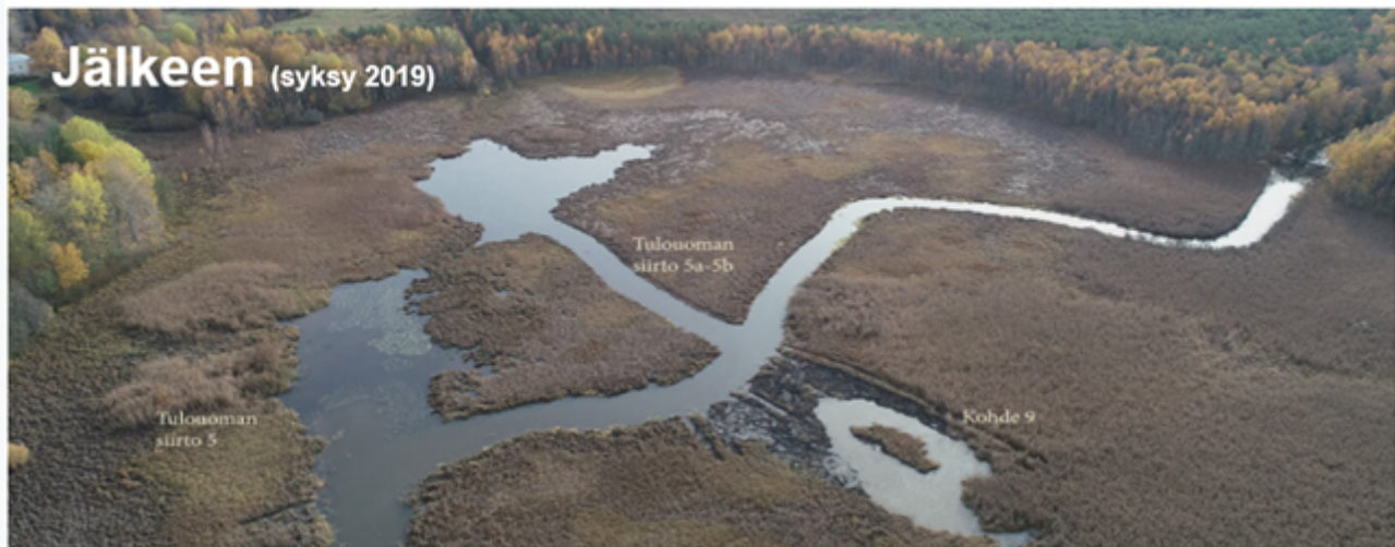
Kuva1. Freshabit-hankkeessa toteutettuja Valkeakosken Saarioisjärven lintuvesikaivuita 2019.

Kosteikolla vähennetään Kukkiaan päätyvää kuormitusta. Se tarjoaa elinympäristön vesi- ja rantalinnuille.