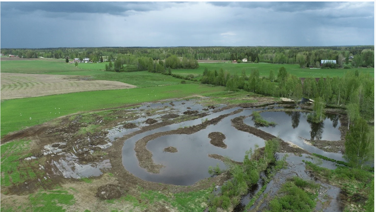
Kuva 2. Rautajärven kosteikko kaivuiden jälkeisenä keväänä 2022.