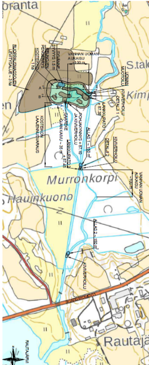
Kuva: Rautajärven Myllyjoen suunnitelmapaketti.