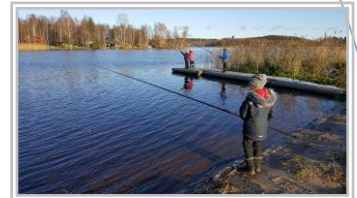
Onni-Monnin luontokerhoissa retkeiltiin koulun lähirantaan mm. tutkimaan veden elämää sekä treenaamaan kalastustaitoja.

Tammikuussa starttaa HAMKin ja Vanajavesikeskuksen yhteinen kaksivuotinen vesistömatkailuhanke. Tavoitteena on kehittää kansainvälisiä, eri teemaisia melontareittejä, vesiluontopolkuja ja kalastuspaikkoja sekä luoda niille monikanavaista näkyvyyttä. Toimivat reitit ja palvelut sekä niiden aktiivinen markkinointi avaavat uuden mahdollisuuden luonto- ja maaseutumatkailun liiketoiminnalle sekä lisäävät maaseudun asukkaiden liikunta- ja virkistysmahdollisuuksia.