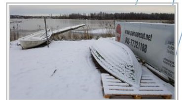
Veneilykausi on tältä vuodelta ohi. Suuren suosion saavuttanut lainapaatti oli vesillä tänä vuonna ennätyskelliset 170 kertaa!

Hausjärven Punkanjoki kärsii mataloitumisesta ja umpeenkasvusta. Punkanjoen alaosalta laadittiin kunnostussuunnitelma, jossa pyritään uoman aukaisuun ja isosorsimon vähentämiseen. Kunnostussuunnitelma löytyy osoitteesta http://www.vanajavesi.fi/punkanjoen-kunnostussuunnitelma-2017/ . Punkanjokea käytettiin esimerkkinä Hämeen ELY-keskuksen raportissa, joka käsitteli vesienhoidon ja perkausyhtiöiden vesioikeudellisia velvoitteita. Raporttiin voi tutustua osoitteessa http://urn.fi/URN:ISBN:978-952-314-625-9 .